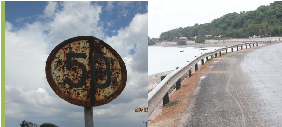
Picha 3.2a: Alama ya mwanzo wa mwendo wa kilomita 50 kwa saa imeliwa na kutu. Picha ilipigwa na wakaguzi maeneo ya Chimala, barabara ya Igawa, Mbeya (TANZAM) tarehe 20/12/2016